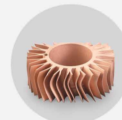
散热器 打印材料: 纯铜 散热器内部复杂螺旋流道 散热片最小壁厚0.5mm