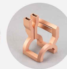
感应线圈 打印材料: 纯铜