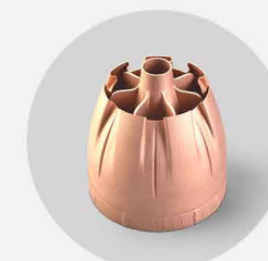
发动机尾喷管 打印材料: 铜铬锆 底部叶片厚度0.7mm