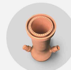
燃烧室 打印材料: 铜铬锆 流道1mm*1.35mm