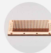
散热底板 打印材料: 纯铜